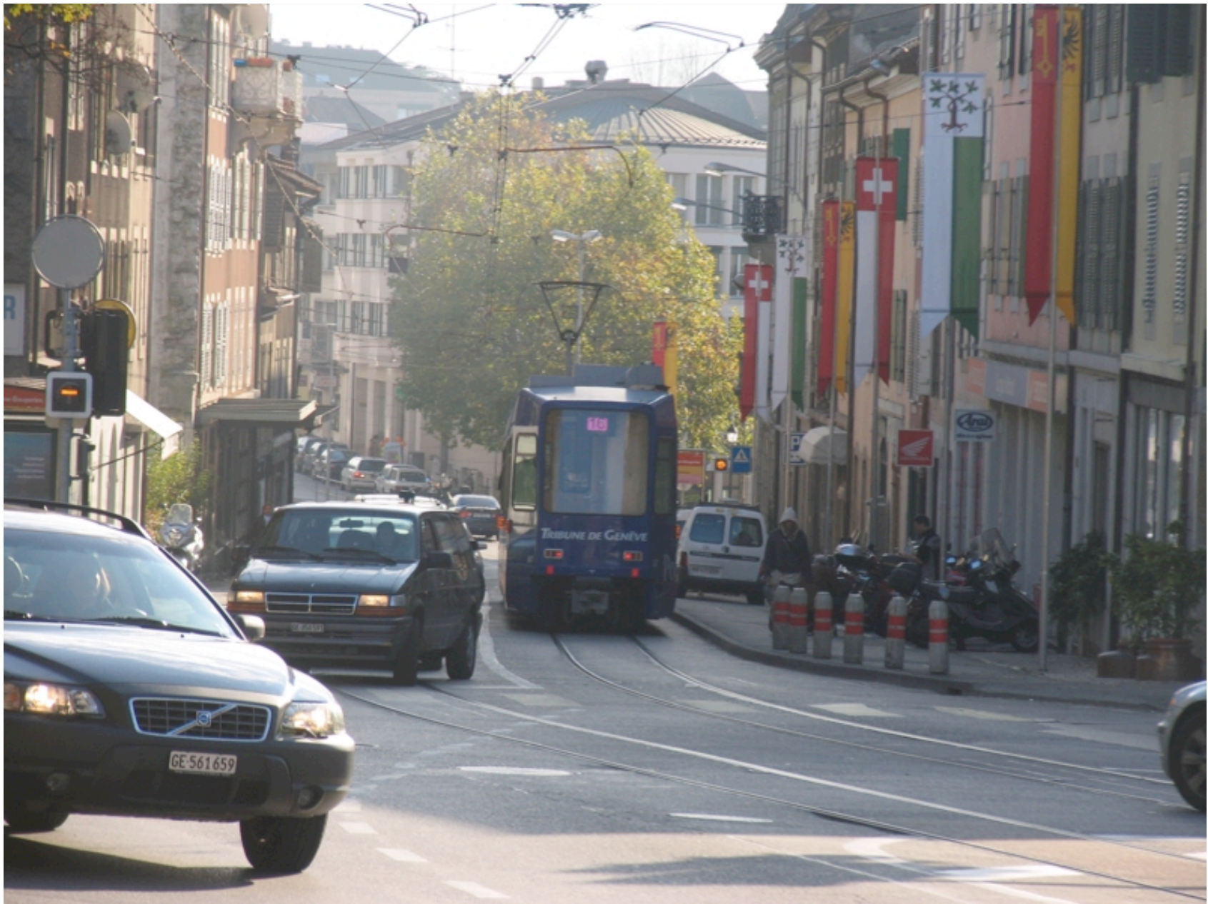
Drapeaux...Vitrine de la Suisse.