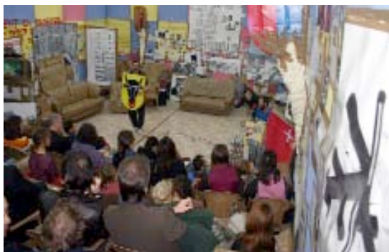
Swiss Swiss Democracy, Thomas Hirschhorn, Centre culturel suisse de Paris, photo Romain Lopez