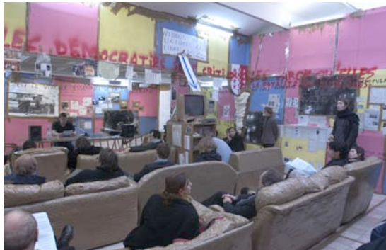
Swiss Swiss Democracy, Thomas Hirschhorn, Centre culturel suisse de Paris, photo Marc Damage / Tutti

Images en haute définition disponibles/ eguigo@ccsparis.com