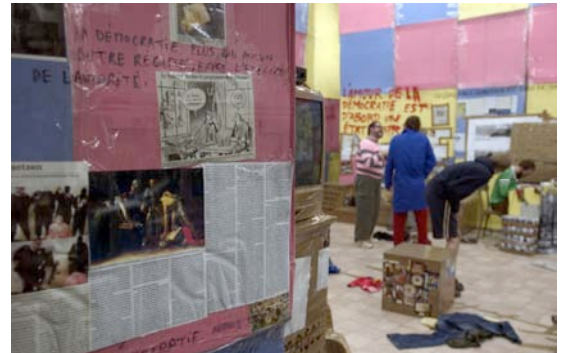
Swiss Swiss Democracy, Thomas Hirschhorn, Centre culturel suisse de Paris