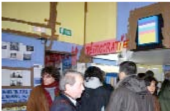
Swiss Swiss Democracy, Thomas Hirschhorn, Centre culturel suisse de Paris, photo Romain Lopez