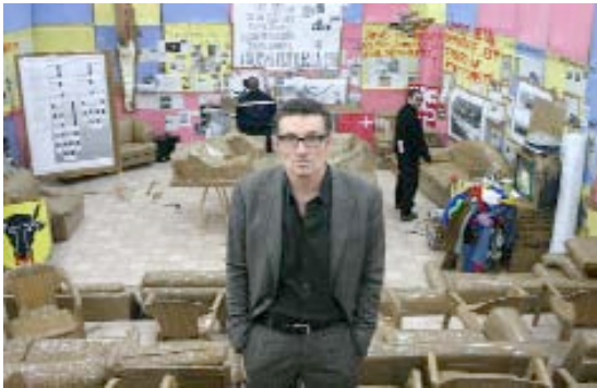
Swiss Swiss Democracy, Thomas Hirschhorn, Centre culturel suisse de Paris

Images en haute définition disponibles/ eguigo@ccsparis.com