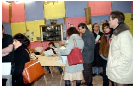
Swiss Swiss Democracy, Thomas Hirschhorn, Centre culturel suisse de Paris