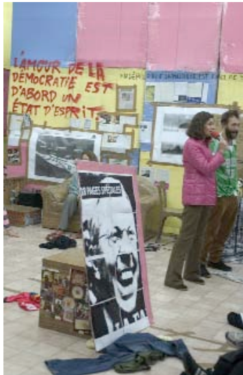
Swiss Swiss Democracy, Thomas Hirschhorn, Centre culturel suisse de Paris