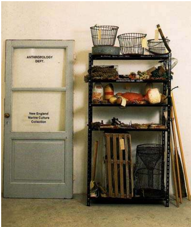
Dion, Mark, Center for the Preservation of Coastal Marsh Zoology , from "Angelica Point", 1994 - Anthropology Department from "Angelica Point", 1994, Massachusetts Botanical Survey, from Angelica Point, 1994

La démarche de Mark Dion n'est-elle pas justement à l'opposé de celle d'un spécialiste : ses exhibitions de déchets n'ont-elles pas avant tout un rôle didactique et de vulgarisation ?