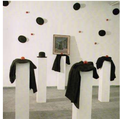
Dimitrijevic, Braco, Triptychos post historicus or hoppers and ways of identity , 1. Le beau ténébreux, René Magritte, 1950, 2. Coats from Mea She'arim, hats gift of David Redberg, 3. Apples

Les peintres, sculpteurs et architectes ont été soutenus, au cours de l'histoire, par l'église, par le prince, par l'Etat, par le parti. Aujourd'hui, le vrai pouvoir en place étant le pouvoir économique, il semble que l'art soit condamné à devoir être soutenu par les entreprises. Comme souvent, les Etats-Unis nous montrent une voie qu'il sera hélas difficile de ne pas suivre à moyen terme avec des salles de musées systématiquement sponsorisées par des entreprises privées ou de riches particuliers. En Suisse, alors que les pouvoirs en place tendent à réduire de plus en plus les prestations publiques, dans les domaines de la santé, de l'éducation ou de la culture, la création risquent d'être condamnée à n'être soutenue à l'avenir que par des banques ou des vendeurs de bijoux. Que vont devenir, ces prochaines années, les musées publics, les écoles d'art et le système des bourses fédérales. Nos dirigeants ont déjà leurs écoles, leurs cliniques, leurs voitures, leurs salles de sport, leurs médias, leurs polices. Pourquoi alors défendraient-ils les services publics ? Ils ont les moyens de continuer à faire voter pour eux et peuvent tranquillement travailler à supprimer les impôts. Pourquoi n'auraient-ils pas également leurs propres musées, comme c'est déjà le cas pour la Migros ou l'UBS ? De telles institutions