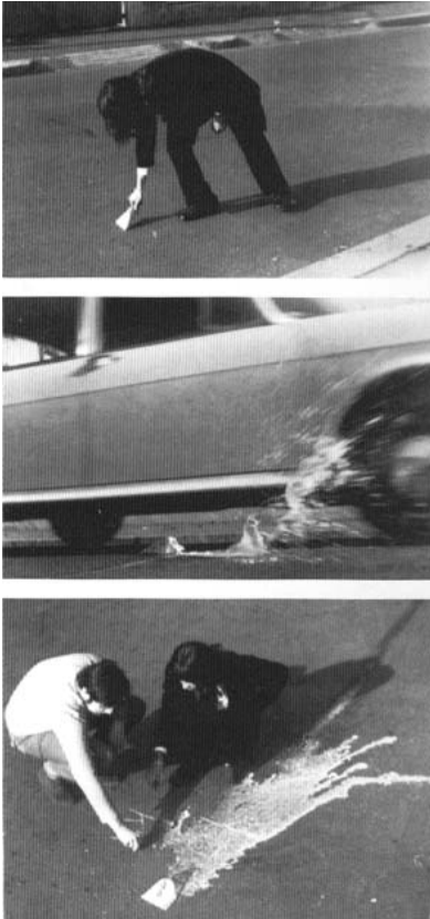
Peinture de Kresimir Klika, 1969 (initiée par Braco Dimitrijevic)

Si Barthes 6 et Foucault 7 proclamaient hier la mort de l'auteur, on peut constater aujourd'hui que ses droits sont quant à eux bien vivants. Le copyright est sans cesse évoqué, à tort et à travers, dans le pseudo débat sur les MP3 ou les photocopies par exemple. On en arrive à l'absurdité totale de dire qu'une diffusion gratuite et massive d'une œuvre signifie la mort de l'artiste. La peur des majors n'est évidemment pas de voir des artistes mourir de faim (elles nous ont largement démontré qu'elles peuvent fabriquer de nouvelles stars "jetables" à volonté) mais qu'une alternative s'offre aux chanteurs notamment qui pourraient dans un avenir proche se passer d'elles et vendre directement leur musique online, à un prix raisonnable. Le cas du MP3 est exemplaire car il met en scène une confrontation exacerbée entre le mercantilisme artistique ambiant et une alternative sociale de l'art. Le système largement dominant du financement de l'artiste via la vente d'objets tangibles doit être remis en cause.