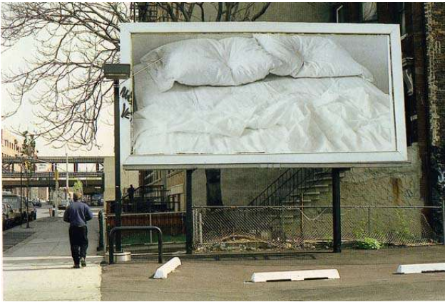
Gonzalez-Torres, Felix, Untitled , 1993, billboard, variable dimensions